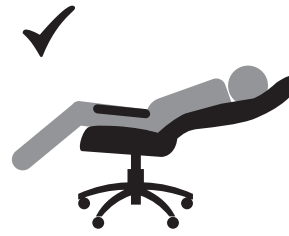
ВЕС ДОЛЖЕН БЫТЬ РАСПРЕДЕЛЕН НА ВСЕ СИДЕНЬЕ