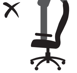
НЕ СТОЙТЕ НА КРЕСЛЕ