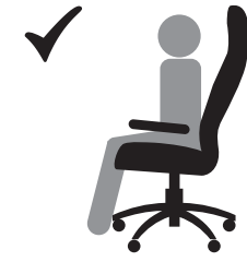
СИДИТЕ НА ВСЕМ СИДЕНИИ